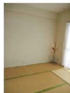
お子さんも快適に過ごせる和室