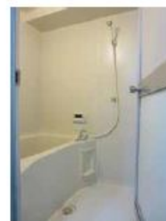
うれしい追焚き付バス