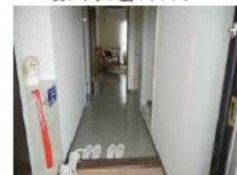
シューズ・ボックス、廊下にも収納あり