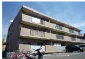
敷地内駐車場もございます!