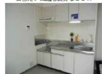
使いやすい広々キッチン