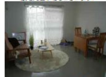
日当たり・風通し良好なLDK