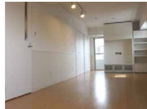
奥行きがあり広さを感じる室内