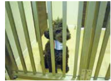
飛び出し防止ペットフェンス