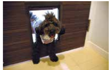
出入り自由ペットくぐり戸