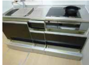
収納力のあるシステムキッチン