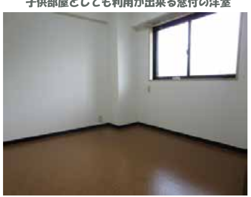
※写真は別室となります。図面と現況が異なる場合は現況を優先とします。