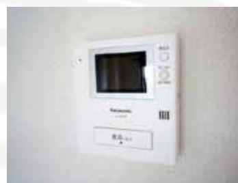
内装 リフォーム 済み