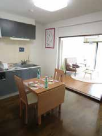
お料理がしやすい システムキッチン