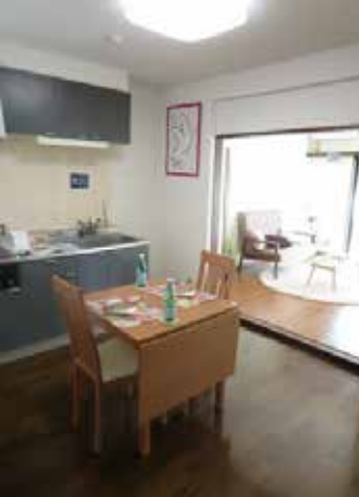
お料理がしやすい システムキッチン