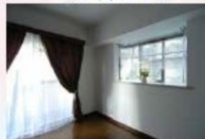
日当たり良好の2面採光の居室