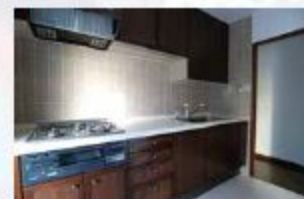
収納スペース充実のシステムキッチン