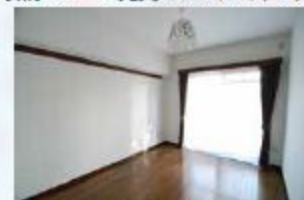
風通しの良い開放的なお部屋