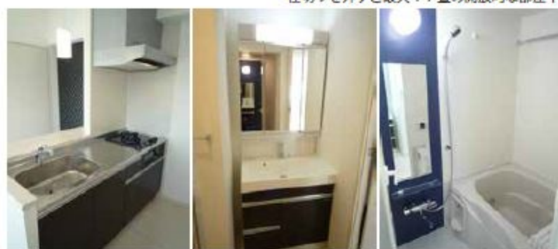
※写真はカラーが異なる別室となります。図面と現況が異なる場合は現況優先とします。