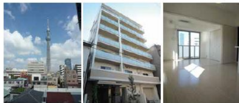
仕切りを外すと最大17畳の開放的な部屋↑