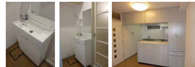
浴室手前に洗面台新設いたします カウンターキッチンが嬉しい