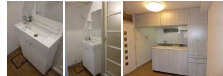
浴室の手前に洗面台を新規設置いたします