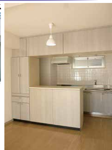
カウンターキッチンは収納も多くて便利