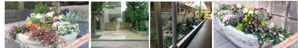
2017年5月に中庭のリフォームを行いました。内見時にご確認ください