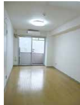
西側は通りに面していないため、東側よりもさらに閑静です。