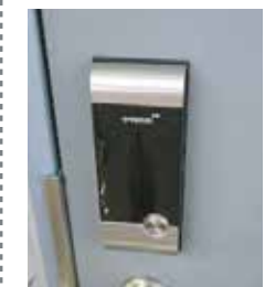
安心のデジタルロックキー採用