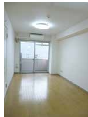
窓を開けると爽やかな風が吹き込みます。