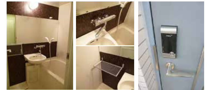
浴室リフォームいたしました