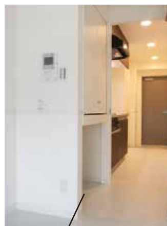
ペットトイレスペース